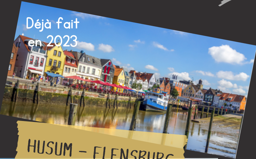
HUSUM - FLENSBURG